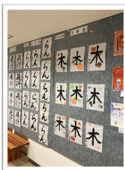
中. 南小学校児童作品