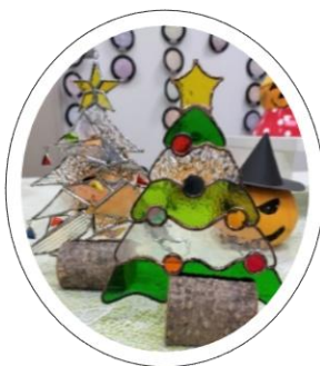
中. ステンドガラス作品