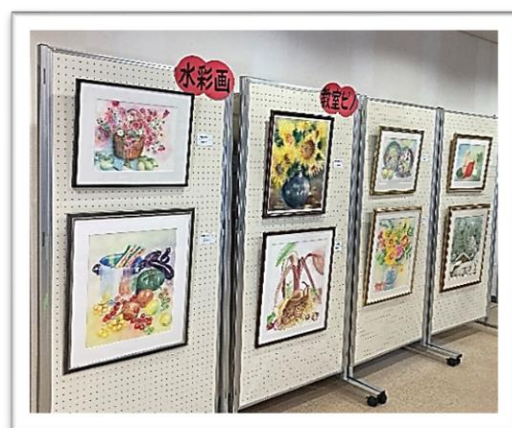
左. 水彩画教室ピノ作品