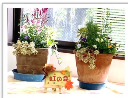
中. 虹の会 寄せ植え