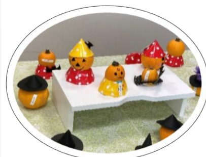
右. 清水南児童クラブ作