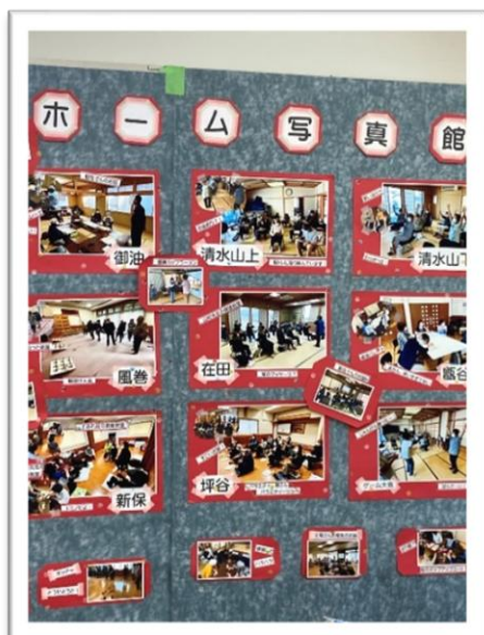
左. 自治会型デイホーム写真展