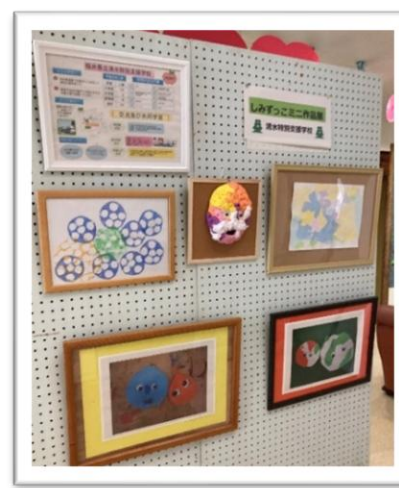
右. 清水特別支援学校児童生徒作品