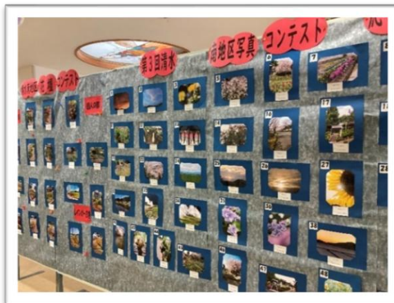
右. 写真コンテスト応募作品